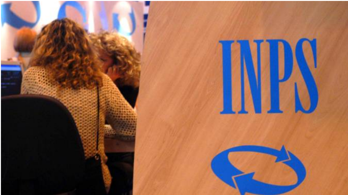
Sportello pensione

Economia Come andare in pensione nel 2023, la guida