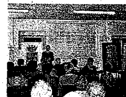
L'INCONTRO AL CENTRO ANZIANI

il video spot interpretato dal testimonial d'eccezione Lino Banfi che mostra una situazione di truffa che coinvolge proprio le persone meno giovani. Si tratta di un individuo che per strada incontra un signore anziano e, fingendosi collega del figlio a cui ha prestato 100 euro, tenta di fargli dare da lui. Il truffatore tenta di intimidire la vittima con toni di voce alti ed aggressivi e pretese di denaro, bloccandolo mentre passeggia tranquillamente. Ma la vittima non si lascia intimidire e pronta-