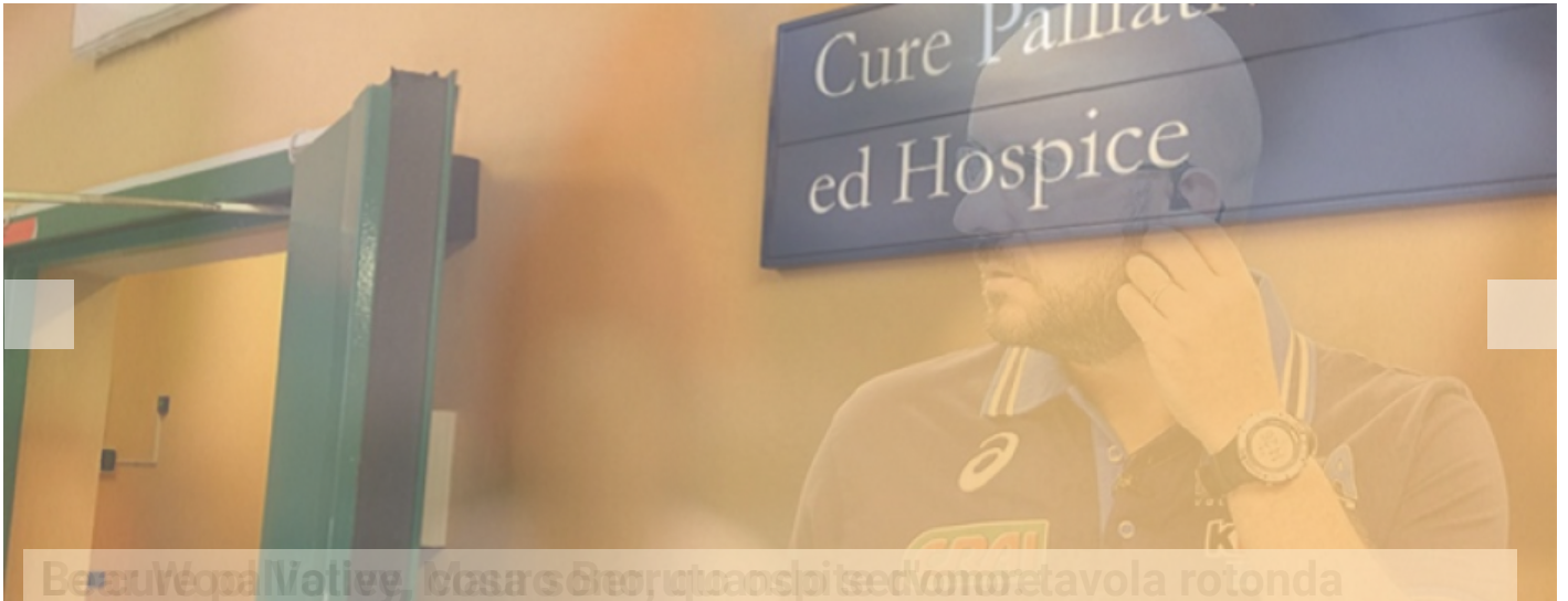
BestiVcoVallee, Msa s Gior utranspise d'omrotavola rotonda